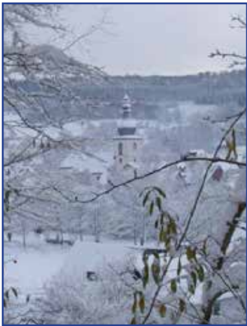
2. Preis Hannelore Elm

1. Preis im Fotowettbewerb: Käthe Maul (siehe Titelblatt)